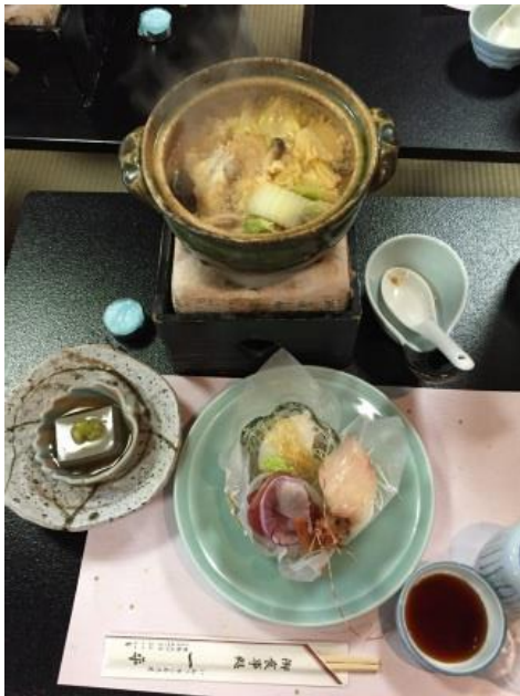
割烹一平の昼食(あんこう鍋)風景