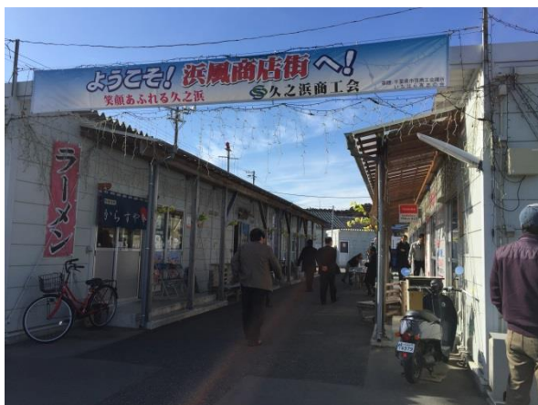
仮設商店街(浜風商店街)